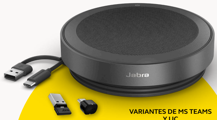
VARIANTES DE MS TEAMS Y UC

Para proteger nuestro planeta, tenemos presente la sostenibilidad cuidadosamente en cada etapa del desarrollo de un producto. La carcasa del Speak2 75 se elabora con más de 33% de materiales sostenibles 3 , con una serie de piezas integradas que se pueden reparar o reemplazar. Mejor sostenibilidad = mayor vida útil del altavoz = llamadas de gran calidad para usted y su equipo durante muchos años.